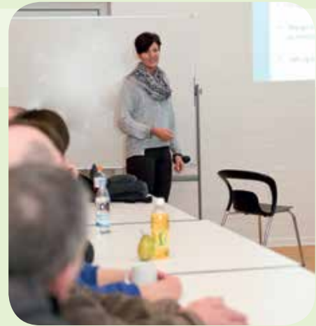
Den daglige undervisning er en stor del af projekt "Slip ledigheden"