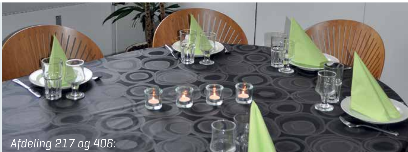
Afdeling 217 og 406: